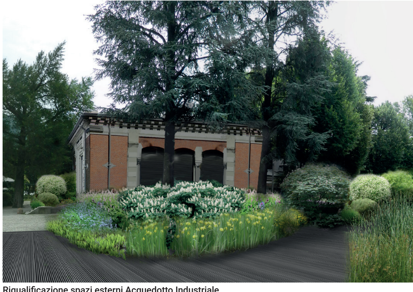
Riquilificazione spazi esterni Acquedotto Industriale