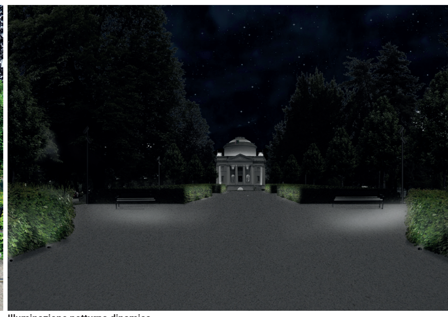
Illuminazione notturna dinamica