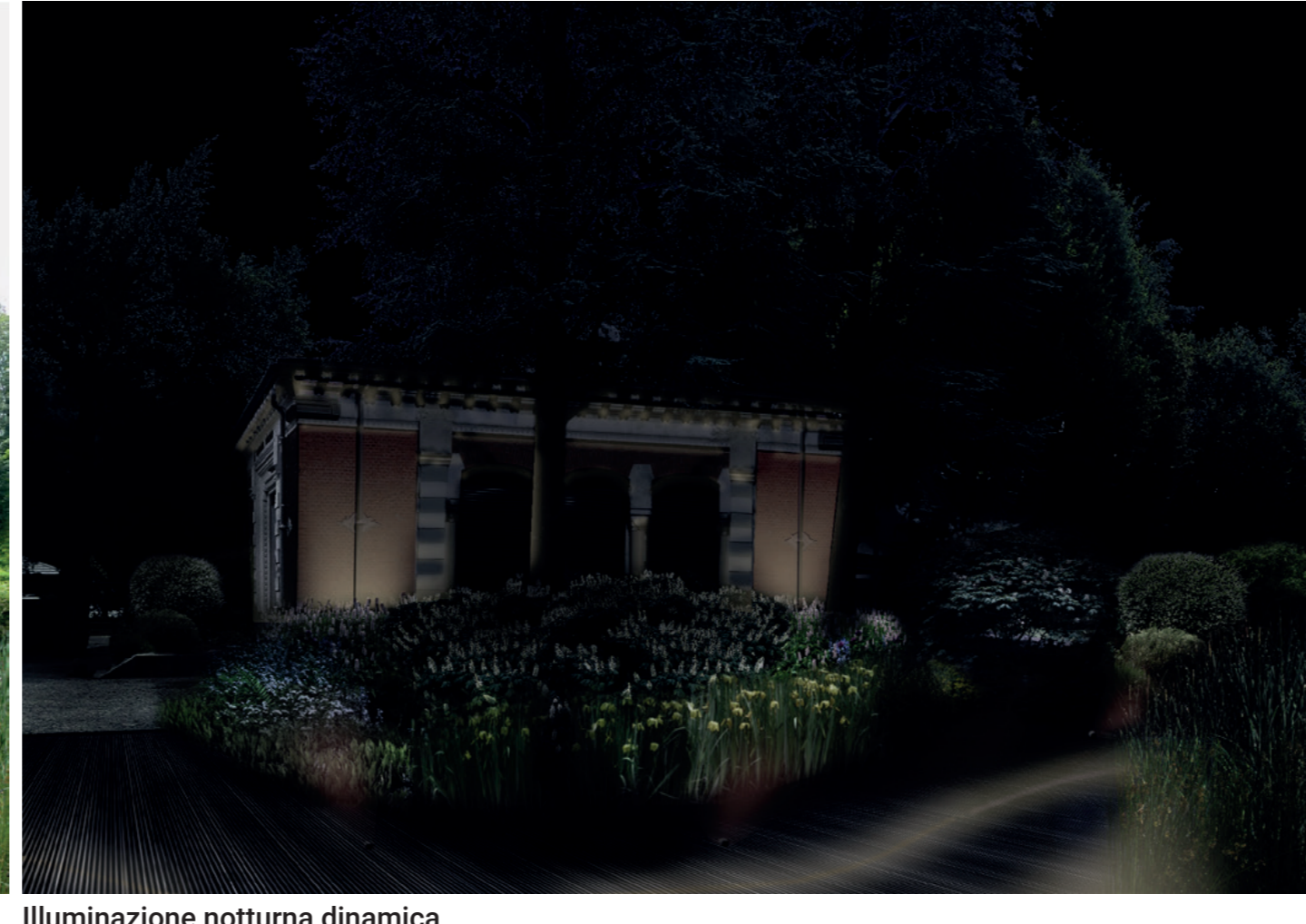
Illuminazione notturna dinamica